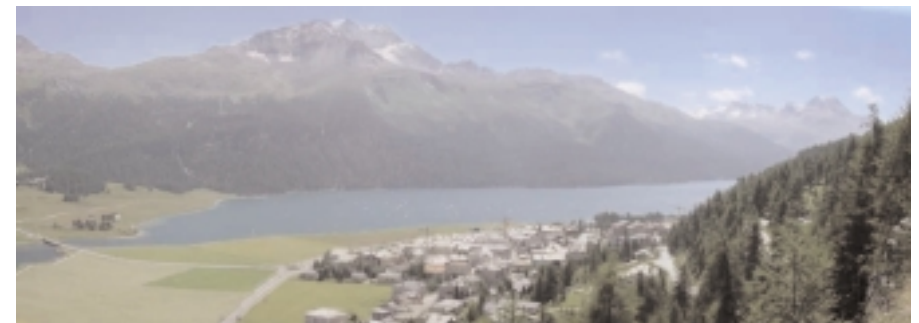
Silvaplannersee Lake Silvaplana